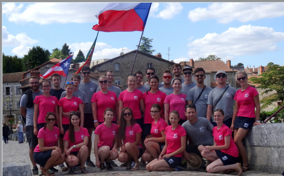
Zahraniční zájezd Francie, Confolens, 5.–17. 8. 2016