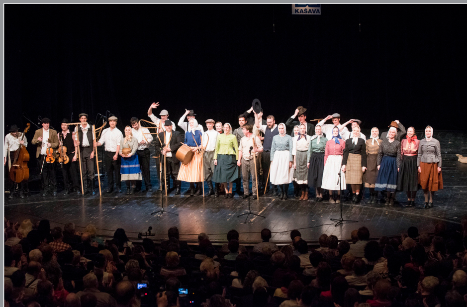
Kašava tančí, zpívá a hraje... už 45 let, Městské divadlo Zlín, 17. 4. 2016