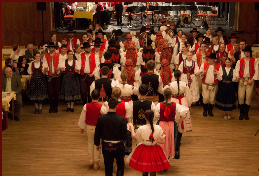
45. valašský bál, Lukov, 6. 2. 2016