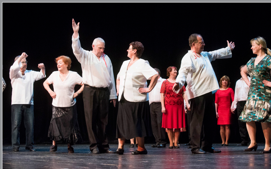
Kašava tančí, zpívá a hraje... už 45 let, Městské divadlo Zlín, 17. 4. 2016