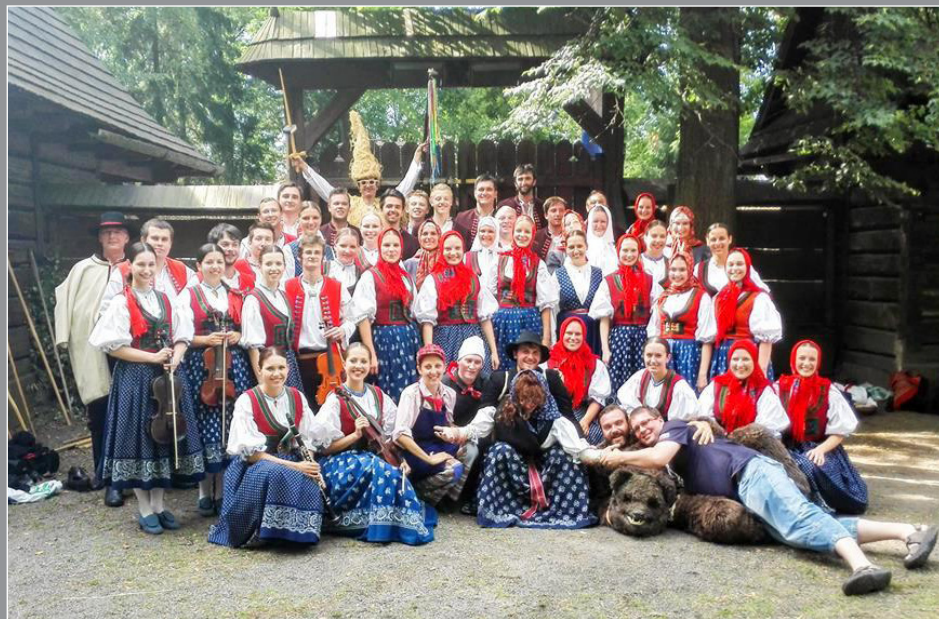
Valašský rok 2016, Rožnov pod Radhoštěm, 10. 7. 2016