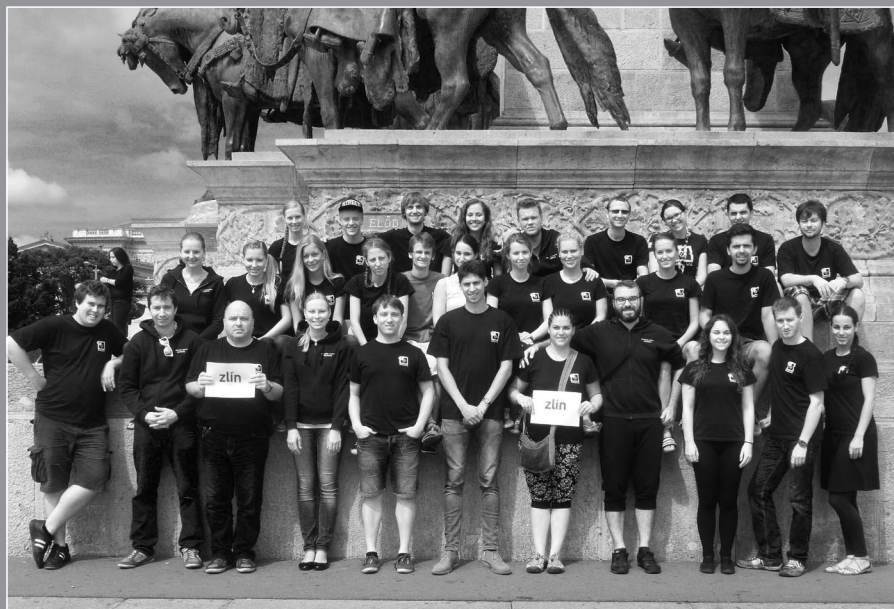
Zahraniční zájezd, Debrecín, Maďarsko, 17.–22. 8. 2015