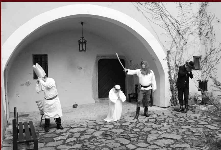
Hra o sv. Dorotě v podání členů „hOLD STÁŘÍ“, hrad Malenovice, 29. 11. 2015