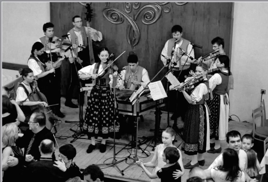
CM VS Kašava, 80. beseda u cimbálu, Lukov, 12. 12. 2015