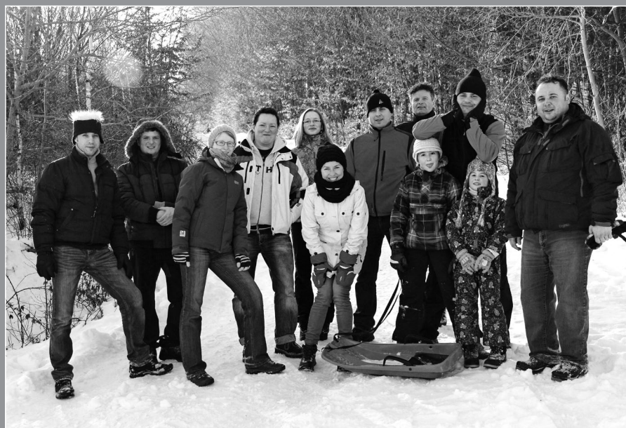
Soustředění CM Kašava, Držková, 6.-8. 2. 2015