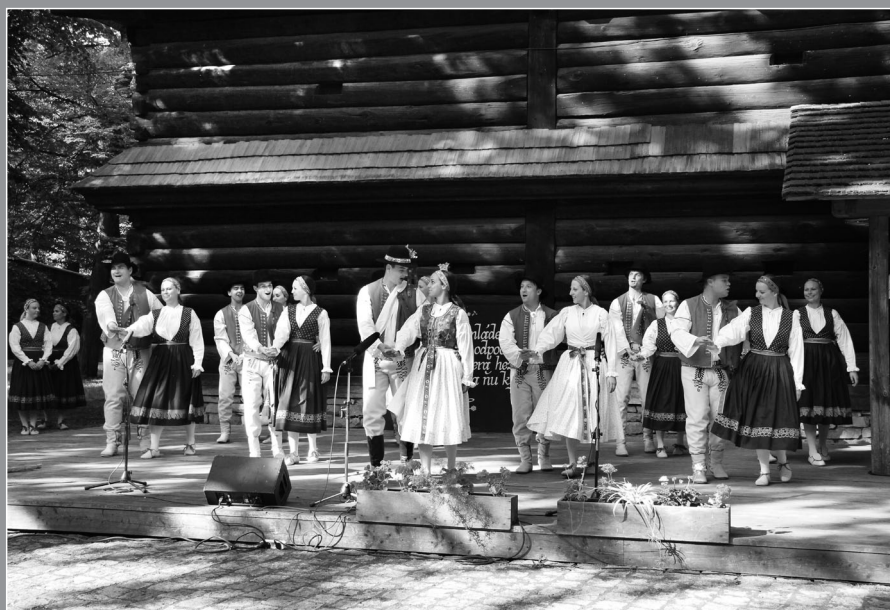
38. MFF Rožnovské slavnosti, 4.–5. 7. 2015