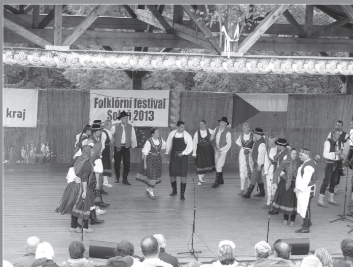
Folklorní festival Soláň (2013).