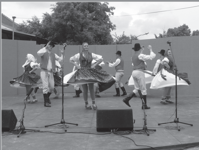
Folklorní slavnosti s jízdou králů, Vlčnov (2013).