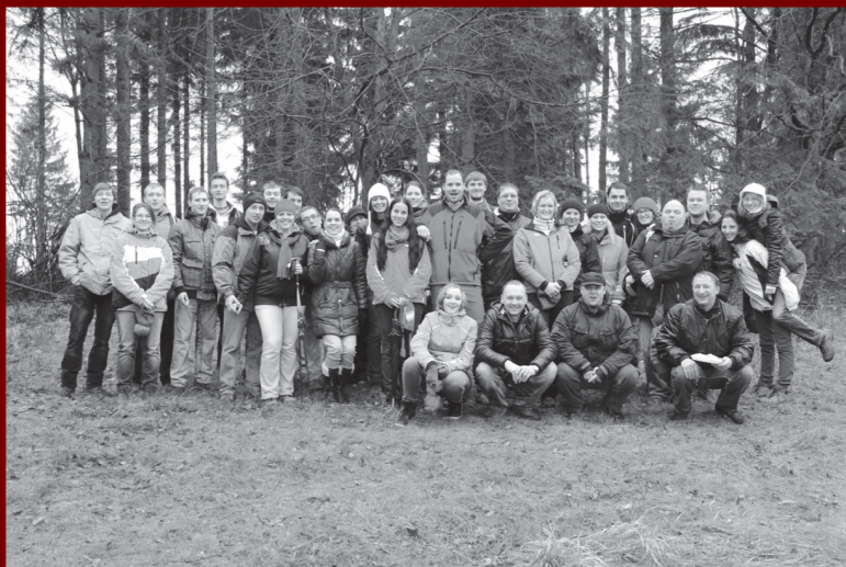
Silvestrovský výšlap (2013)