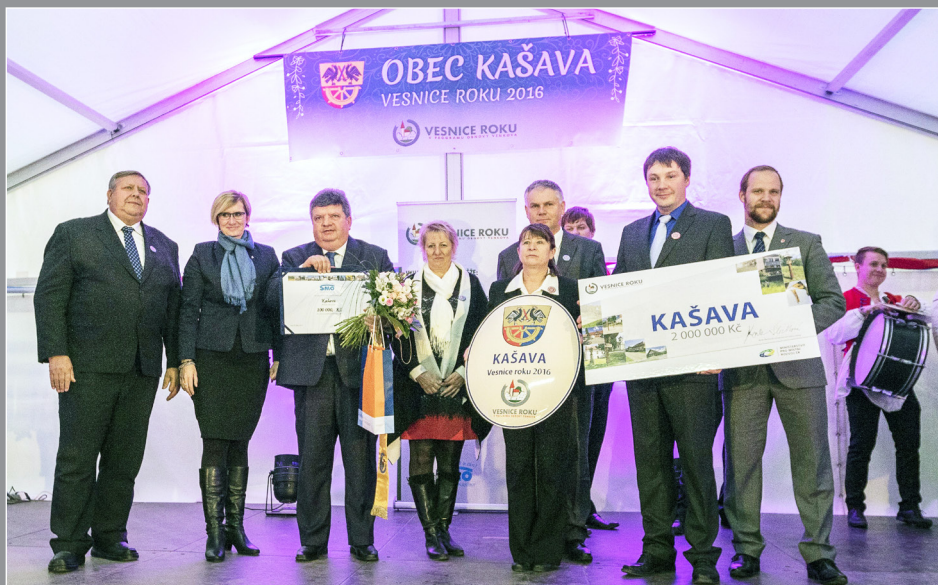
Slavnostní předání ocenění Vesnice roku obci Kašavě (7. 8. 2016)