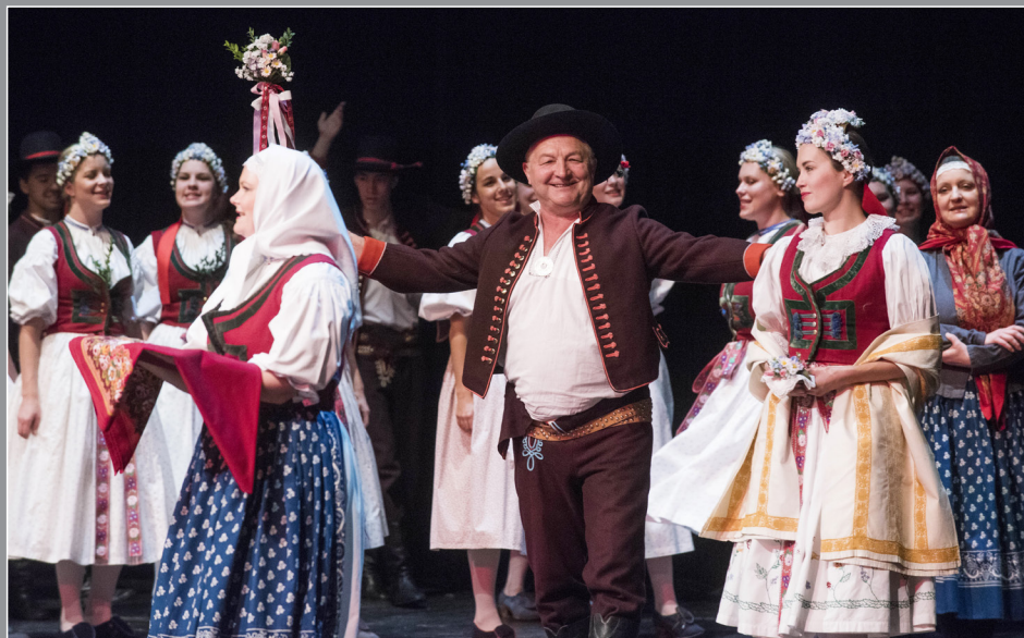
Kašava tančí, zpívá a hraje... už 45 let – Městské divadlo Zlín (17. 4. 2016)