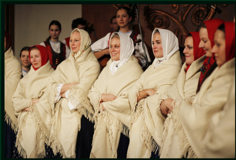
80. beseda u cimbálu – předpůlnoční kašavské koledování (12. 12. 2015)