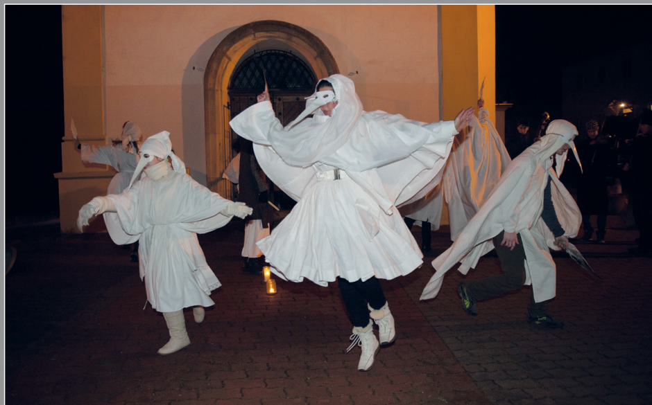
Lucky v podání FS Mladá Haná