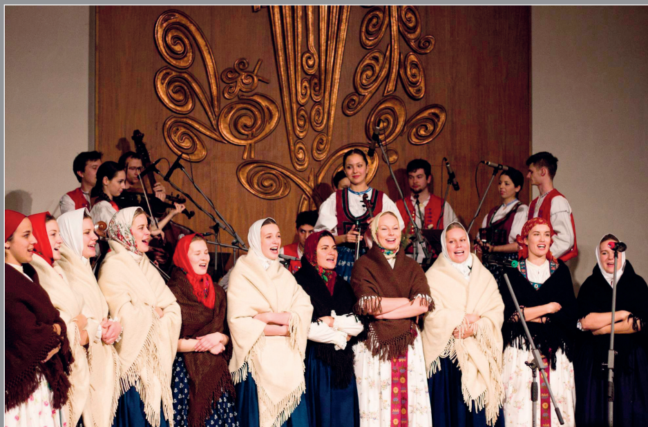
Dívčí pěvecký sbor a CM VS Kašava, Lukov 2016