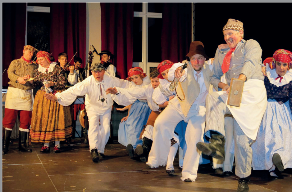
Taneční fraška o dvou svérázných řeznících a nepovedené zabijačce. FS Mladá Haná