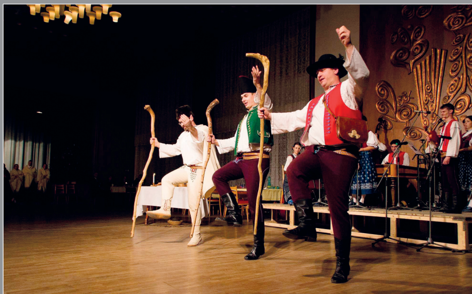
Vánoční lidová hra Pastuši v podání VS Kašava, Lukov 2016