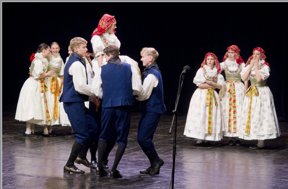
Spolu na stejnou notu, Městské divadlo Zlín, 21. 4. 2024 (choreografie Fryštácká chaso, na zól)