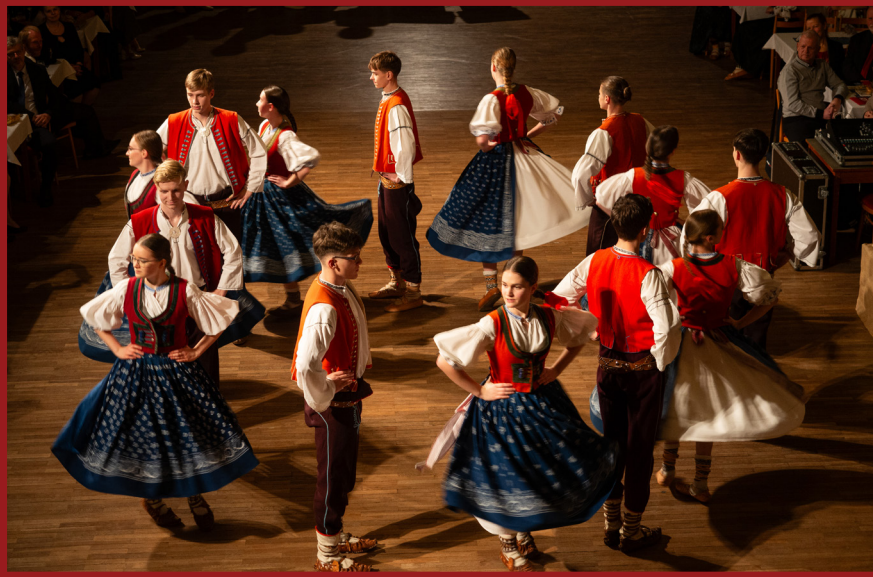
Souborová příprava Mladá Kašava, 51. valašský bál, Lukov, 3. 2. 2024