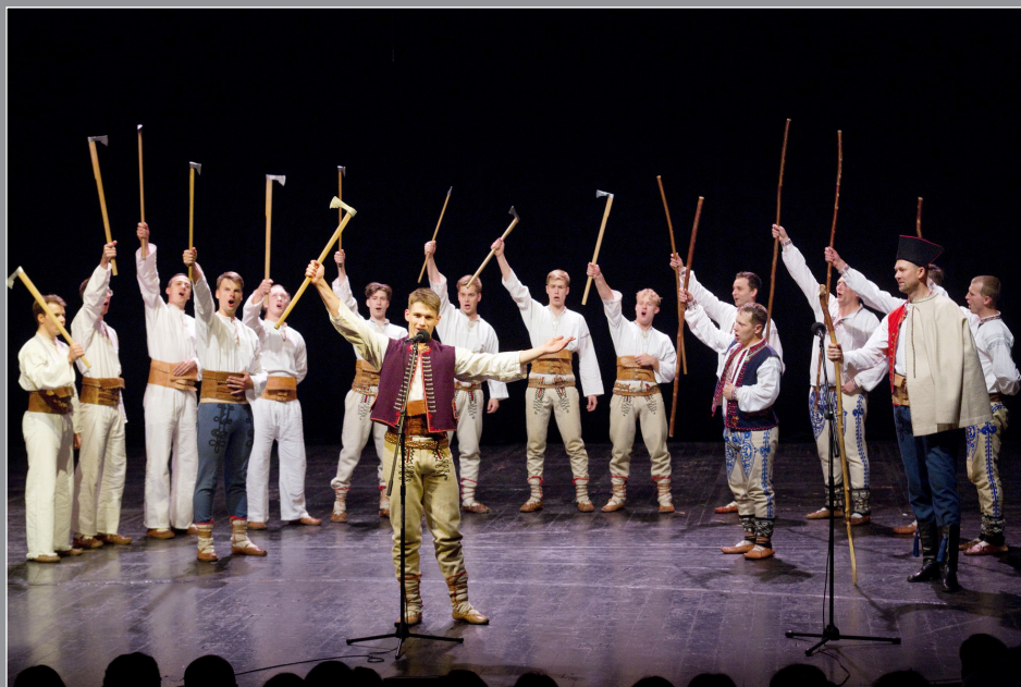
Spolu na stejnou notu, Městské divadlo Zlín, 21. 4. 2024 (choreografie Zavolajte ně Odráša)