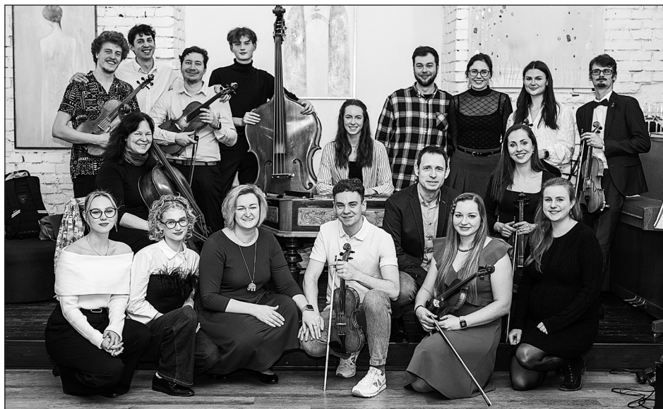
Křest CD Dyž sem já k vám chodívával, Kavárna Továrna, Zlín, 21. 12. 2024