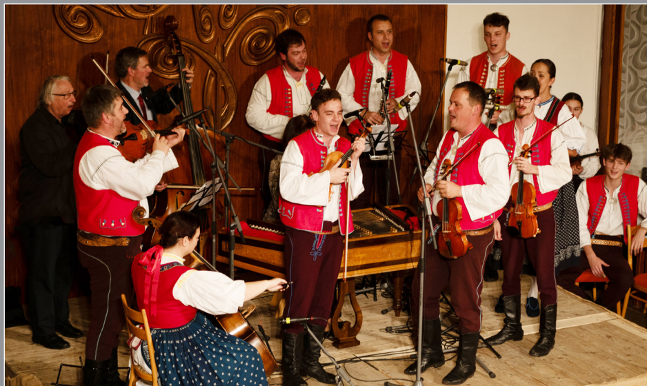
93. beseda u cimbálu, Lukov, 19. 10. 2024