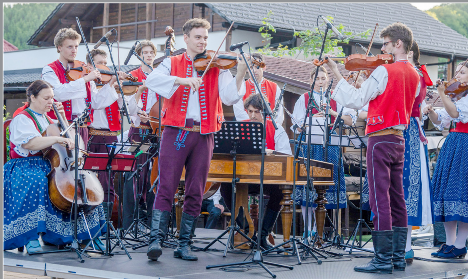
Kašavské slavnosti 2025