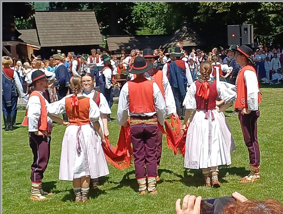
MFF Rožnovské slavnosti 2025, pořad Valašská beseda