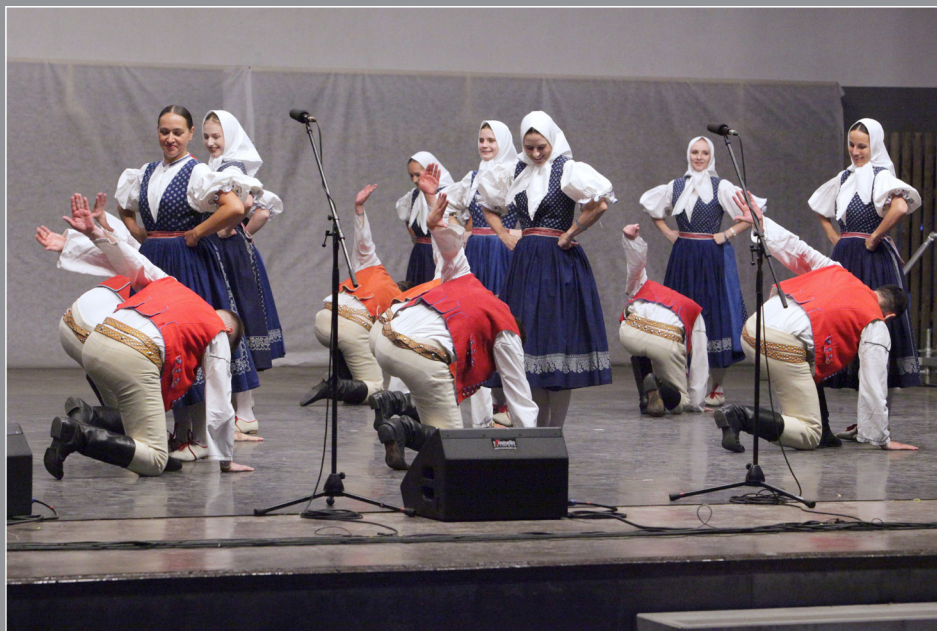
MFF Strážnice 2025, pořad Na tom zlínském rynku (choreografie Pyšná Anka)