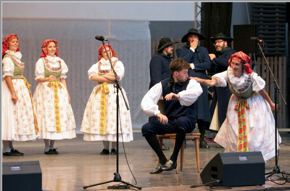
MFF Strážnice 2025, pořad Na tom zlínském rynku (choreografie Fryštácká chaso, na zól)