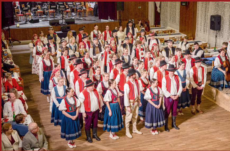
Slavnostní nástup krojovaných, 52. valašský bál, Lukov, 8. 2. 2025